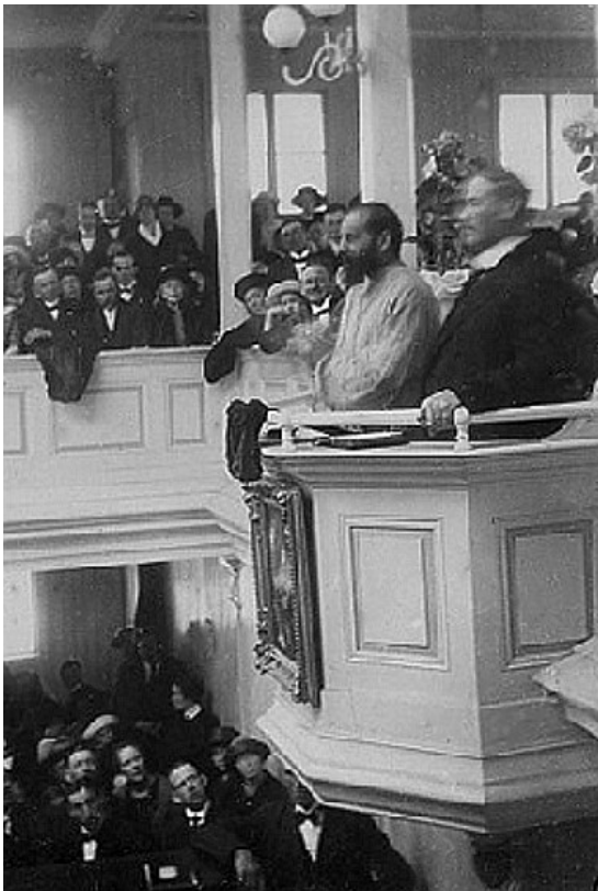
Sundar Singh í predikunarstól

Hann var skírður til kristinnar trúar í ensku trúboðskirkjunni í borginni Simla 3. september árið 1905, 16 ára að aldri.